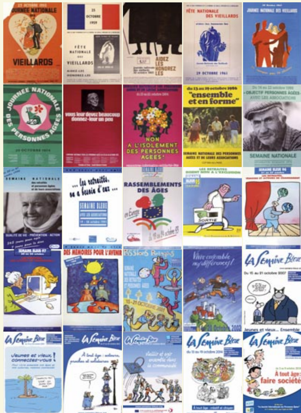
Maquette : Ville de Thiais - Illustrations de couverture et page 6 : la Semaine Bleue - Imprimé à 18 000 exemplaires par Imprimerie RAS/Villiers-le-Bel • NE PAS JETER SUR LA VOIE PUBLIQUE

Centre de loisirs Lionel Terray (39 avenue René Panhard) • CCAT (58 rue Louis Duperrey) • Espace municipal Grignon (10 rue Marcel Dadi) • Résidence Autonomie (13 rue de l'Espérance) • Café-théâtre (98 avenue de Versailles) • Église St-Leu St-Gilles (rue Robert Laporte) • Salle municipale de la Saussaie (56 rue de la Saussaie) • Centre de loisirs Jules Ferry (66 rue Paul Vaillant Couturier) • Médiathèque municipale (rue Chèvre d'Autreville) • Parc André Malraux (18 bis rue Jean Jaurès) • Piscine municipale Monique Berlioux (23 rue de la Saussaie) • Palais Omnisports De Thiais (place Vincent Van Gogh) • Théâtre municipal René Panhard (avenue de la République) • Ludothèque (2 rue des Églantiers)