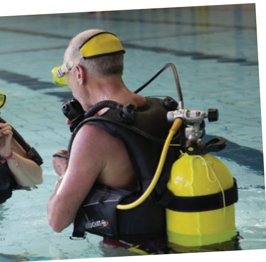
Thiaisais étaient invités par La Palme Thiaisienne à l'occasion d'un baptême dans le bassin de la piscine