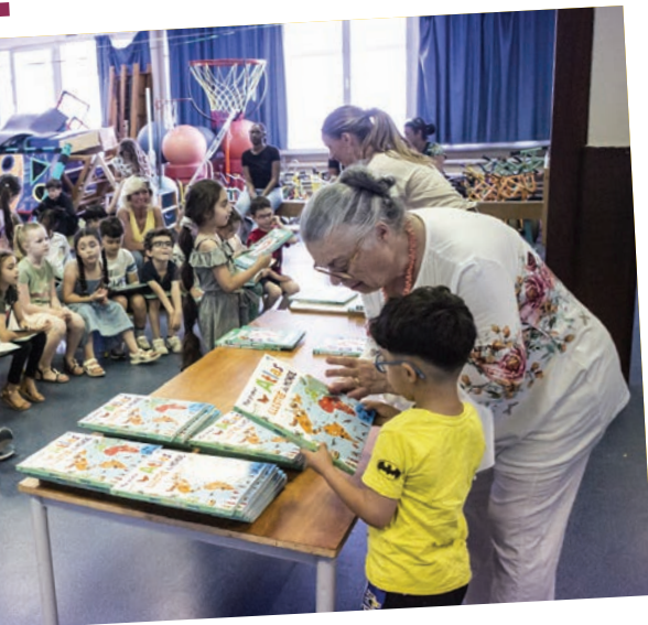
grands de la maternelle St-Exupéry.