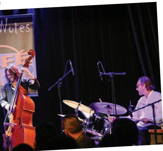
Revenez-vous JazzoNotes de la saison avec le Back Lucky