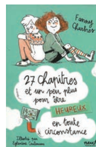
27 chapitres et un peu plus pour être heureux en toute circonstance de Fanny Chartres (l'école des loisirs)