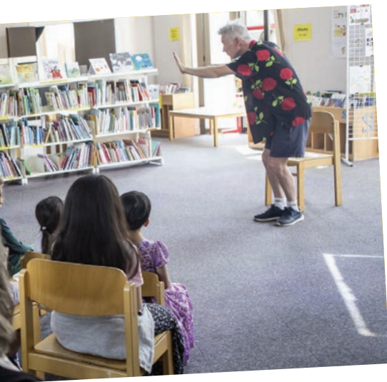
cipale, un comédien de la compagnie Pirouette n conte... moi égale toi, abordant avec le jeune différences de genre, de taille, d'âge, de force,