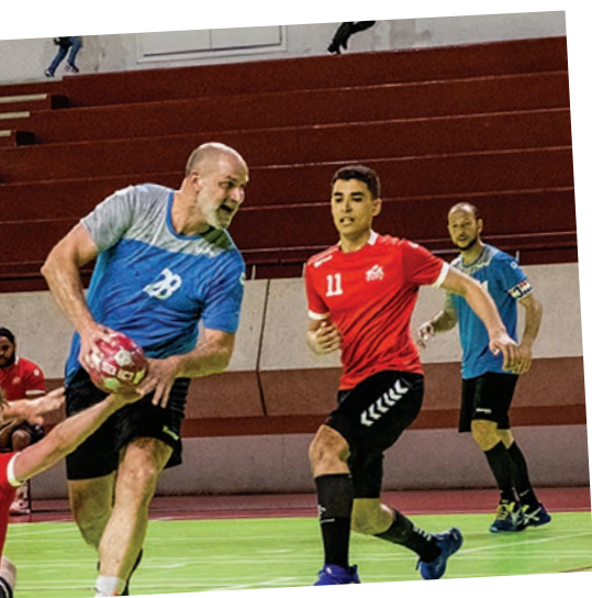
nisports De Thiais.