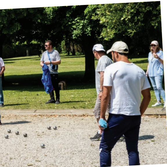
3 anque en doublette se sont succédé sur les terrains cadre du championnat départemental.