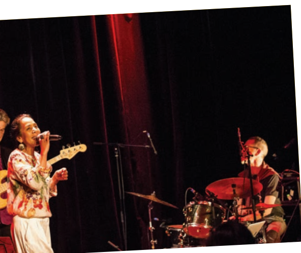
23 ur Jean-Baptiste Amand, proposait au café-théâtre un abeson qui, avec Daddy's project , rendait hommage à abeson.

Après avoir suivi des ateliers relatifs à la sécurité routière, les enfants de l'école Romain Gary ont fièrement reçu leur permis piéton.