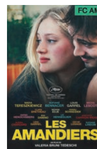
Les Amandiers de Valeria Bruni Tedeschi