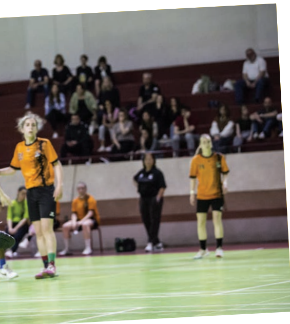
de handball Thiais/Villeneuve-le-Roi