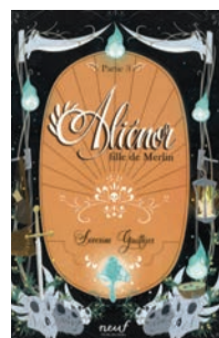
Aliénor fille de Merlin, partie 3 de Séverine Gauthier (l'école des loisirs)