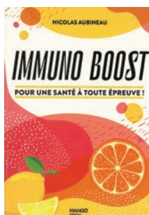
Immuno Boost, pour une santé à toute épreuve de Nicolas Aubineau (Mango éditions)