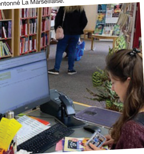
...ent gratuitement des ateliers d'aide à la lecture Coup ...site à la médiathèque municipale pour en découvrir les

Les enfants de l'école maternelle Romain Gary étaient invités par l'équipe d'animation à prendre part à une journée de fête sur le thème du Carnaval.