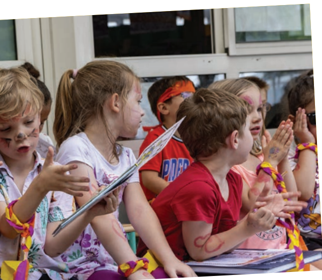
2023 maternelle Jeanne d'Arc.

Remise des prix de fin d'année aux écoliers de la maternelle Charles Péguy.