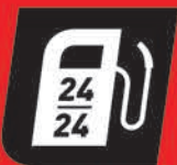
Station service 24/24