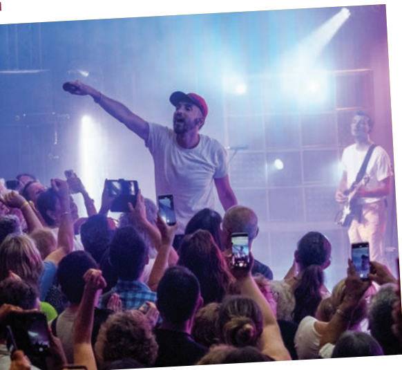
2023 Il avait convié le talentueux Christophe Willem à pour un concert qui a conquis plus de 3200 personnes