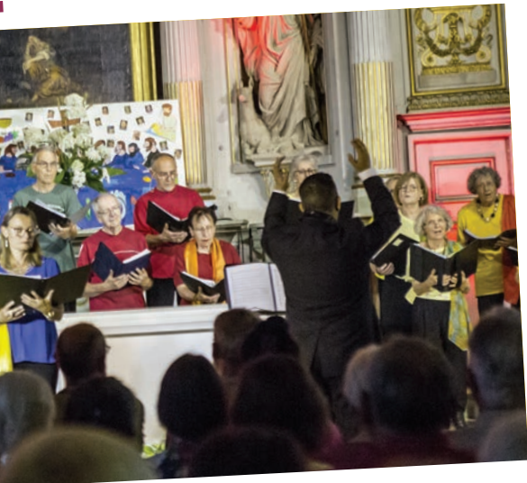
et Chansons, en l'église Saint-Leu Saint-Gilles.