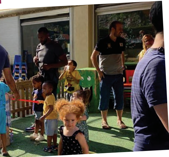
Mail Roland Blanche, Vallée verte et parc de l'Europe.