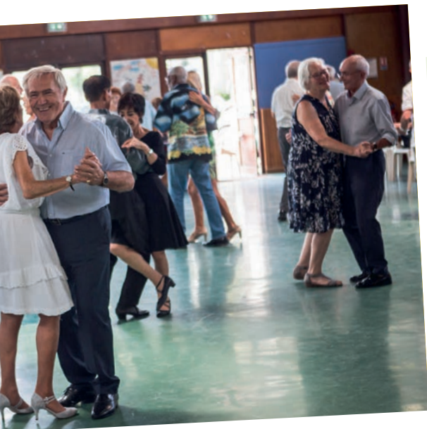
2023 proposé par Thiais Récréation, au centre de loisirs Lionel