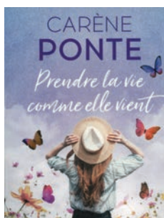
Prendre la vie comme elle vient de Carène Ponte (fleuve Éditions)