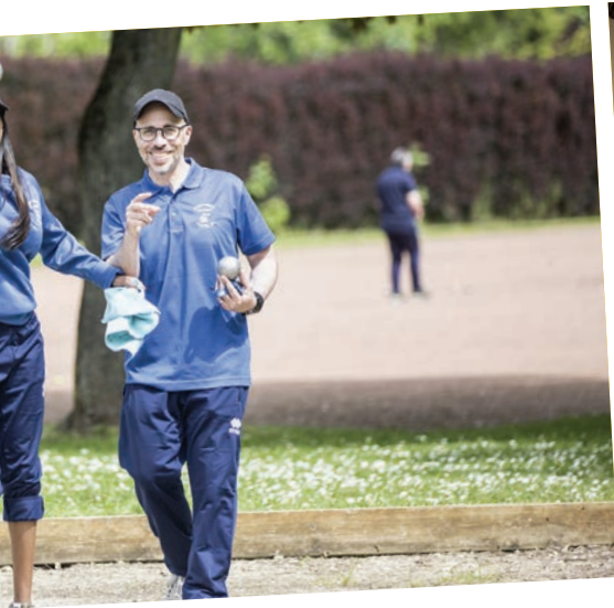
...nque avec des rencontres en double mixte dans le ...rrains du stade municipal Alain Mimoun.