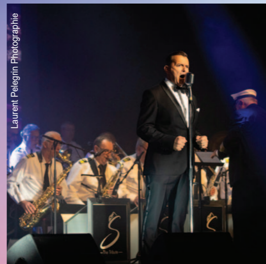
Laurent Pelegrin Photographie